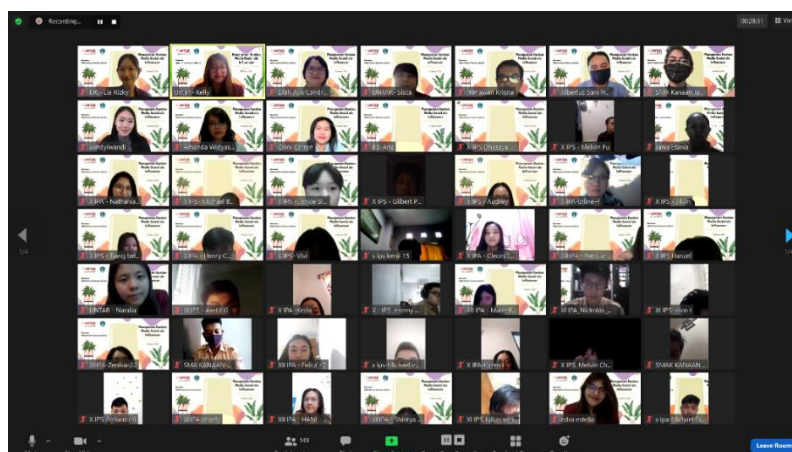
Gambar 2. Kegiatan PKM di SMA Kanaan secara daring

Mitra kegiatan Pengabdian Kepada Masyarakat (PKM) ini merupakan Siswa SMA Kanaan sebanyak 129 orang terdiri dari siswa kelas X-XII. Pembelajaran di SMA Kanaan hanya mengajarkan pelajaran tentang multimedia tetapi tidak mengedukasi tentang penggunaan media sosial. Membangun brand awareness akan pentingnya pembuatan konten di media sosial untuk mendapatkan manfaat lain seperti personal branding , promosi, bisnis, dan lainnya. Siswa diharapkan dapat meningkatnya kesadaran akan pentingnya mempersiapkan diri dalam menghadapi tantangan globalisasi. Usia remaja termasuk kelompok yang rutin mengunggah konten foto kegiatan sehari-hari. Hal ini tentunya harus bisa diantisipasi dari pihak sekolah dengan memberikan edukasi yang baik kepada siswa SMA Kanaan, sebagai generasi muda penerus bangsa, siswa belum memahami pentingnya peran komunikasi untuk menjadi sukses dalam dunia kerja.