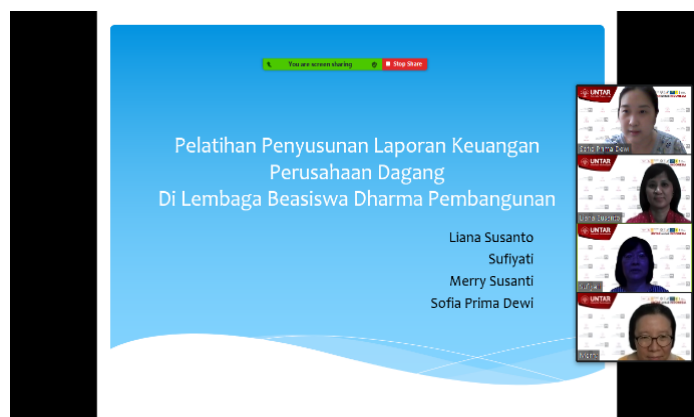
Gambar 1. Foto Kegiatan PKM pada Lembaga Beasiswa Dharma Pembangunan

Kegiatan pembekalan diberikan secara daring pada tanggal 26 Maret 2021 melalui platform Zoom dan dihadiri oleh 4 dosen dan 11 orang siswa/i seperti ditampilkan pada gambar 1.