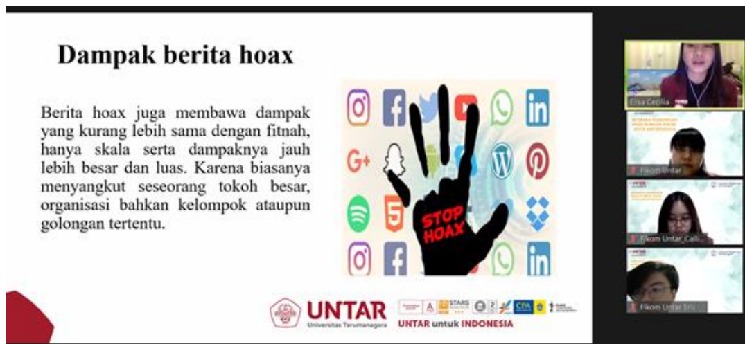
Gambar 2. Dampak Berita Hoax

Terlaksananya kegiatan Pengabdian Kepada Masyarakat di SMK Sumbangih Multimedia menjadi bagian yang tidak terpisahkan dari kehidupan generasi muda khususnya siswa SMA-SMK Sumbangih Multimedia. Pada pelaksanaan Pengabdian Kepada Masyarakat ini terungkap setiap peserta memiliki lebih dari satu akun media sosial dan aktif dalam menggunakan media sosial. Kegiatan media literasi tepat pada sasaran yang dituju serta memberikan pengetahuan yang terkait dengan aspek hukum bagi pengguna media sosial. Peserta menunjukkan ketertarikan dalam kegiatan dengan indikator banyaknya peserta yang terlibat, antusiasme peserta untuk menyimak paparan dari pemateri dan proses diskusi yang menarik perhatian peserta.